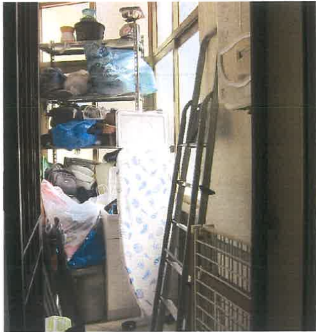
VERANDA CON INGRESSO DALLA LAVANDERIA