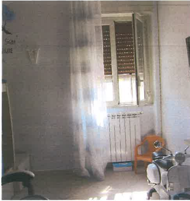
CAMERA LETTO SINGOLO