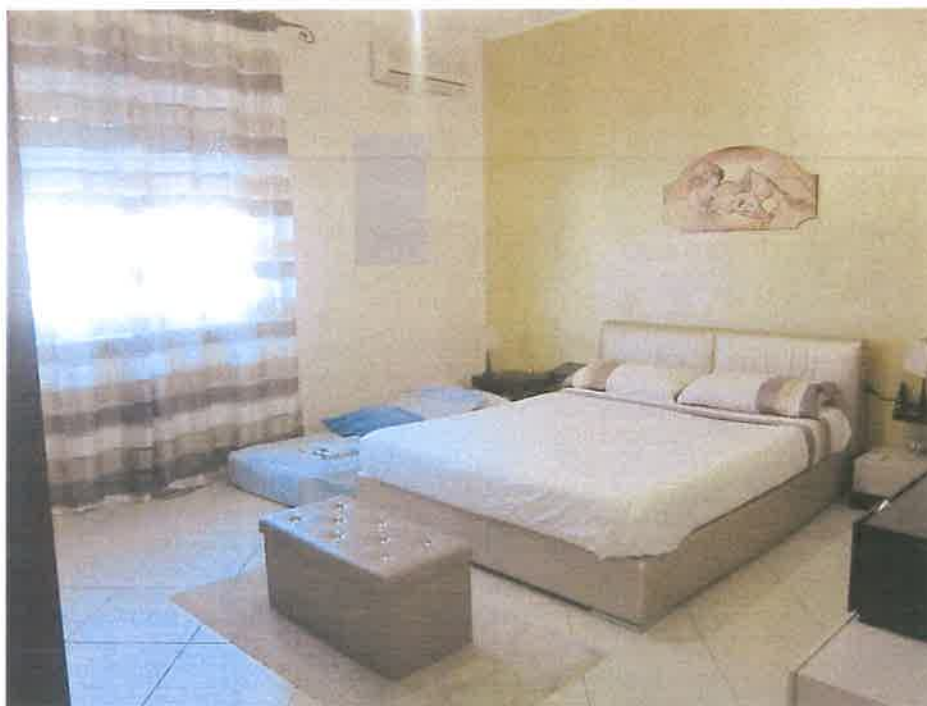
CAMERA DA LETTO MATRIMONIALE (SU LARGO POZZILLO)