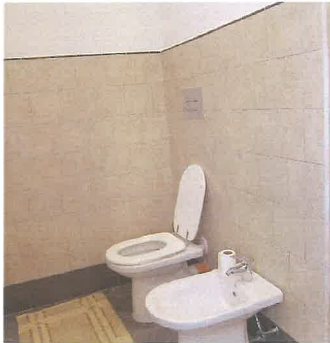
WC E BIDET