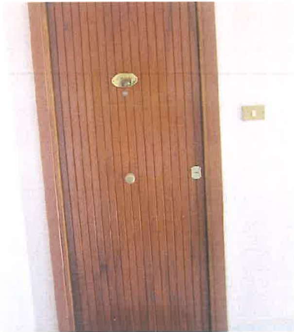
PORTA INGRESSO IMMOBILE