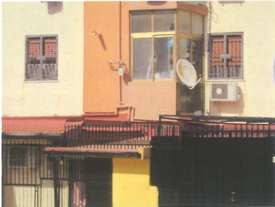
VERANDA SU RETRO PROSPETTO