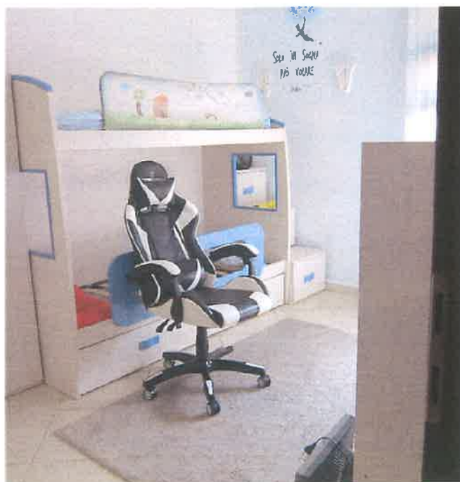
CAMERA LETTO SINGOLO (SU LARGO CALTAVUTURO)