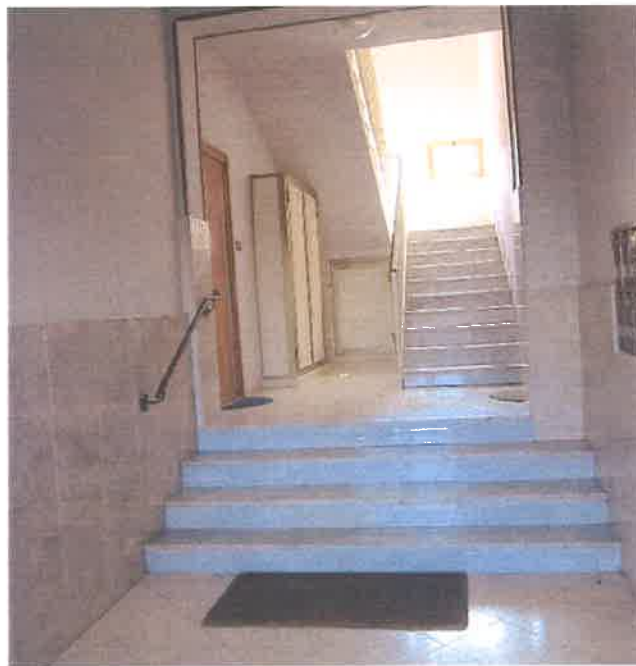
ANDRONE – SCALA CONDOMINIALE