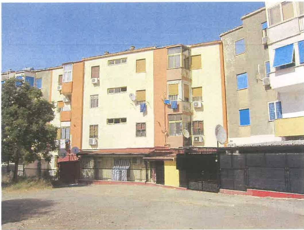
RETRO PROSPETTO SU LARGO CALTAVUTURO