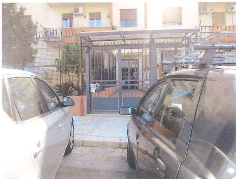
INGRESSO CIVICO N.5