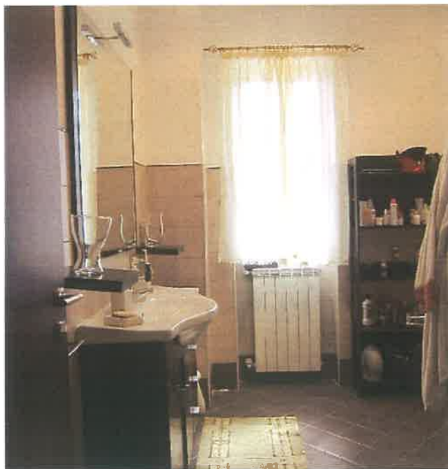
NUOVO SERVIZIO IGIENICO