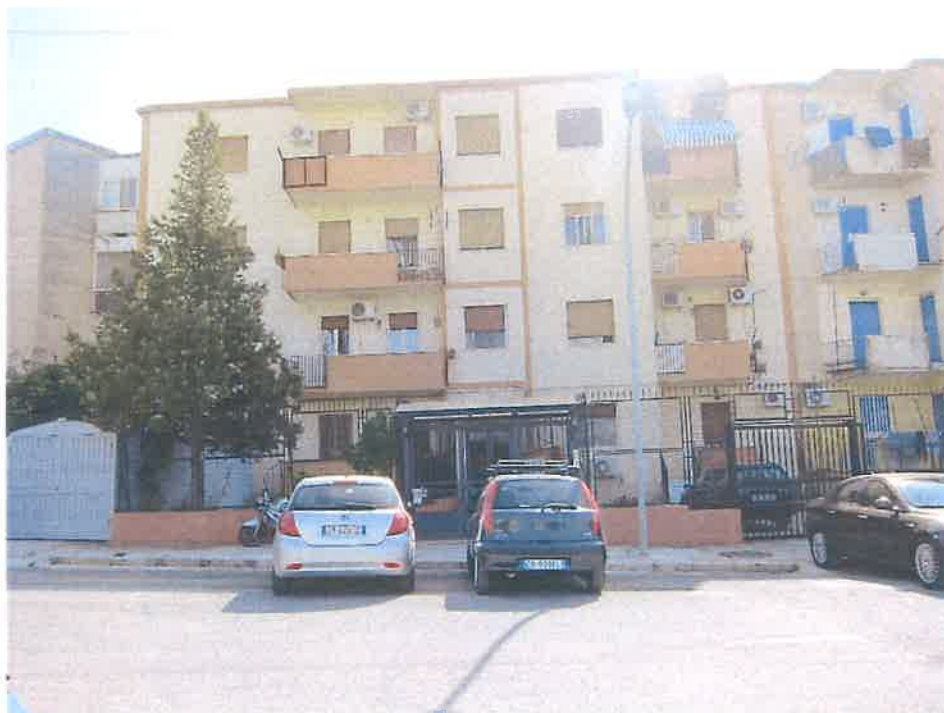
LARGO POZZILLO N.5 PROSPETTO PRINCIPALE