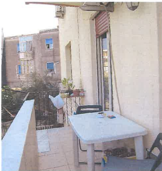
BALCONE SU LARGO POZZILLO