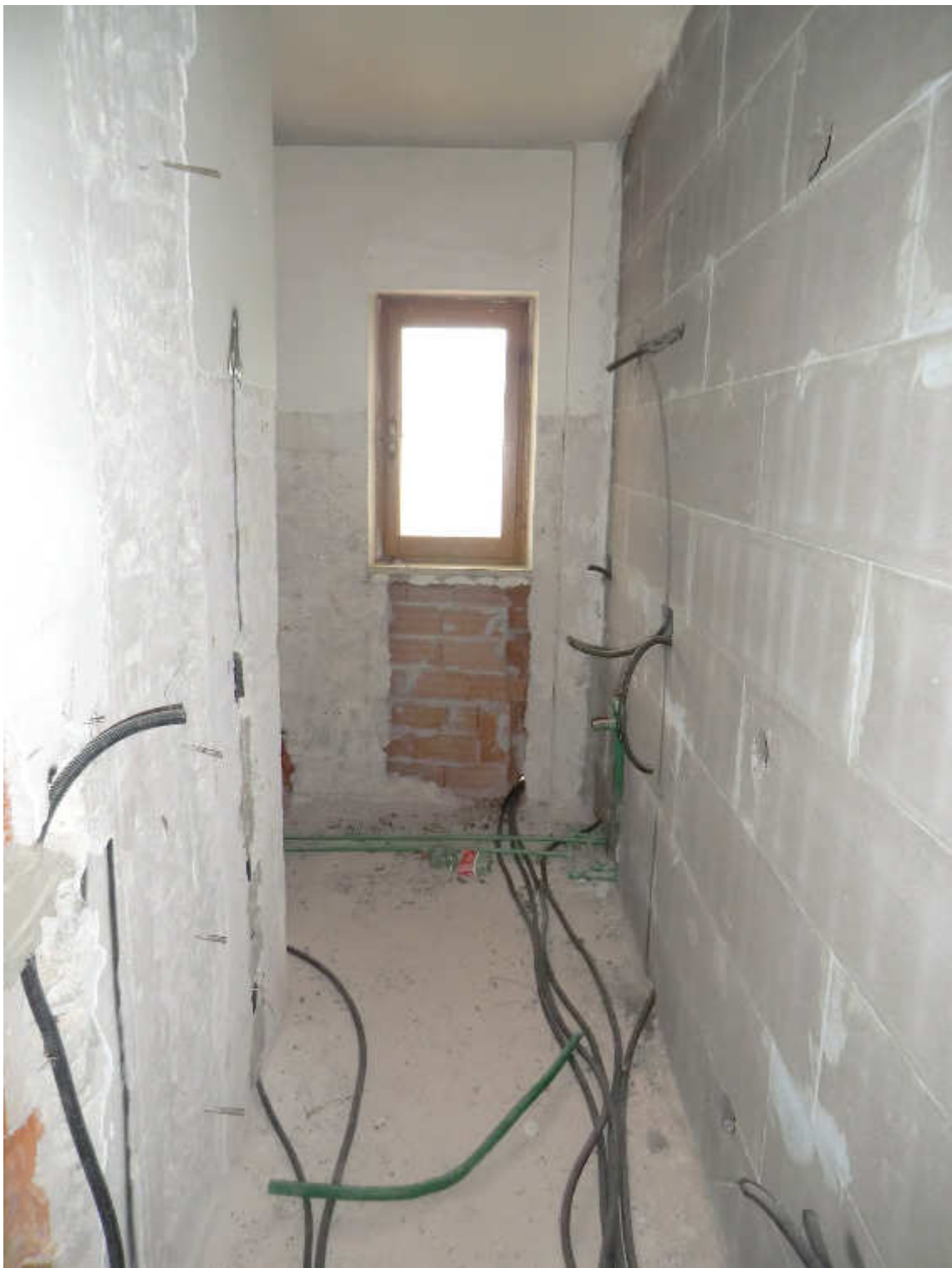
Foto n. 11 - Ingresso del bagno in fase di ristrutturazione