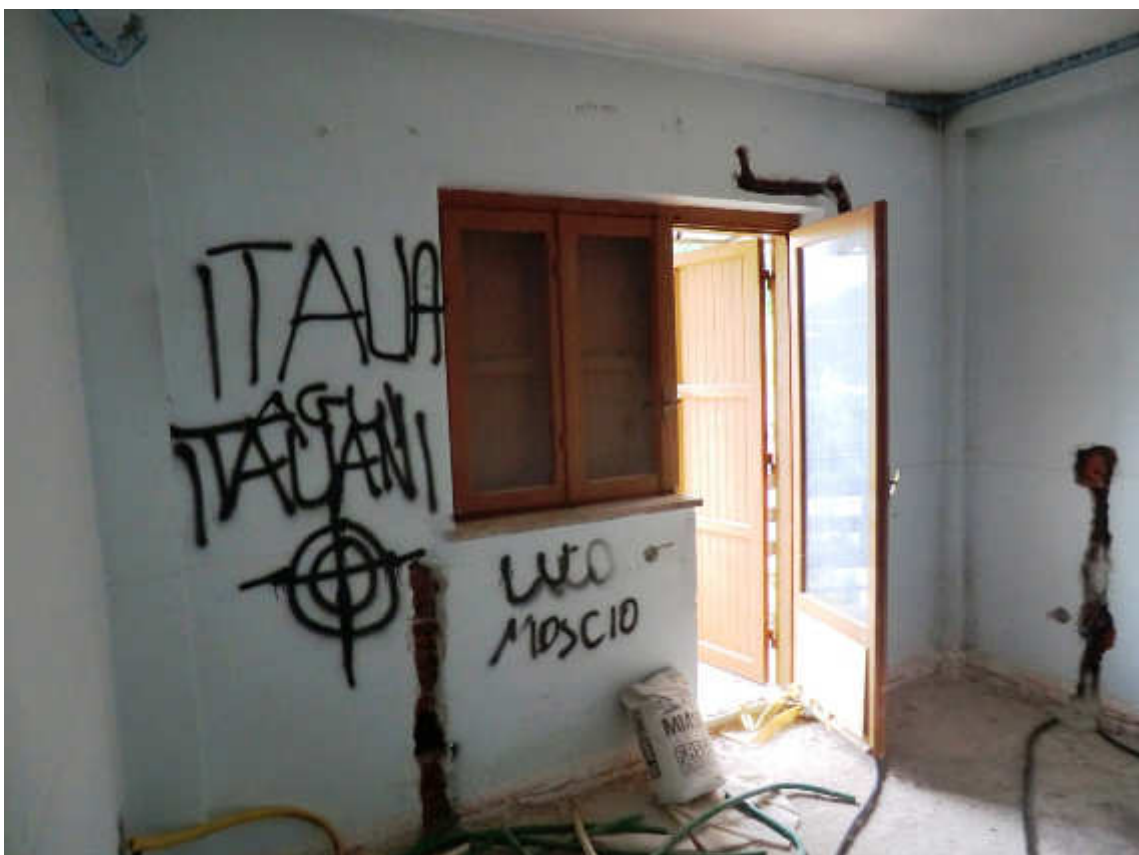
Foto n. 8 - Ingresso dell'appartamento visto dall'interno