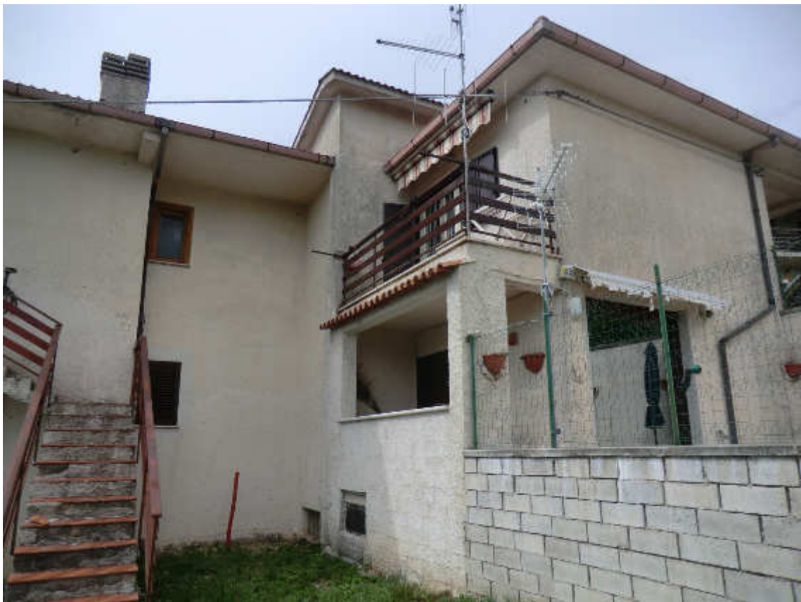
Foto n. 5 - Altra vista posteriore del fabbricato