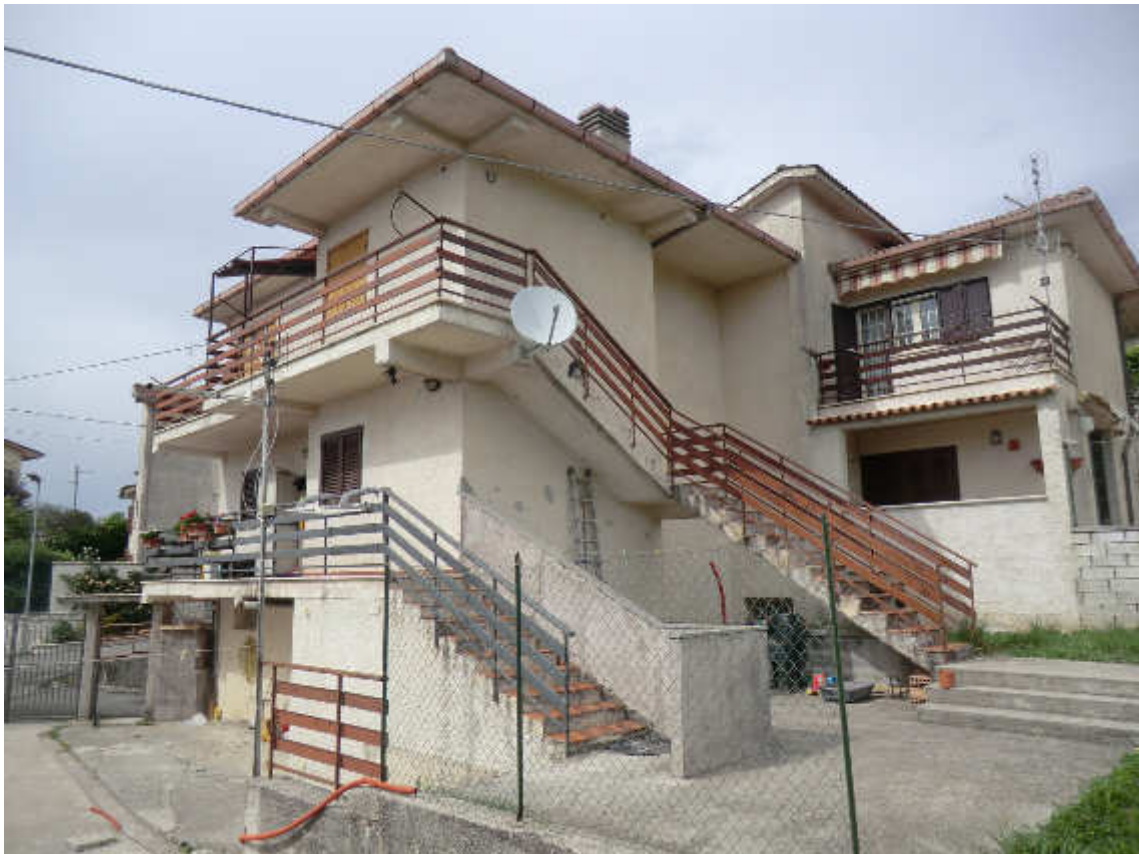
Foto n. 3 - Vista laterale del fabbricato