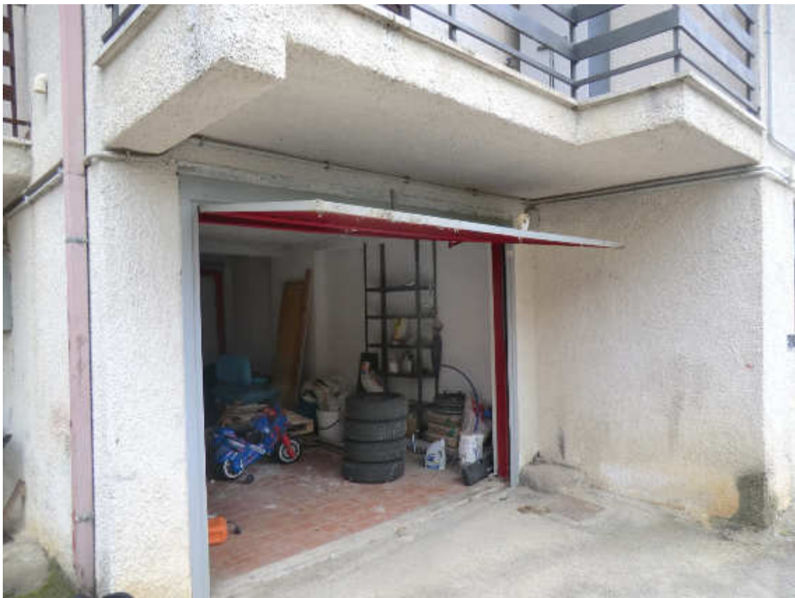
Foto n. 18 - Ingresso del garage