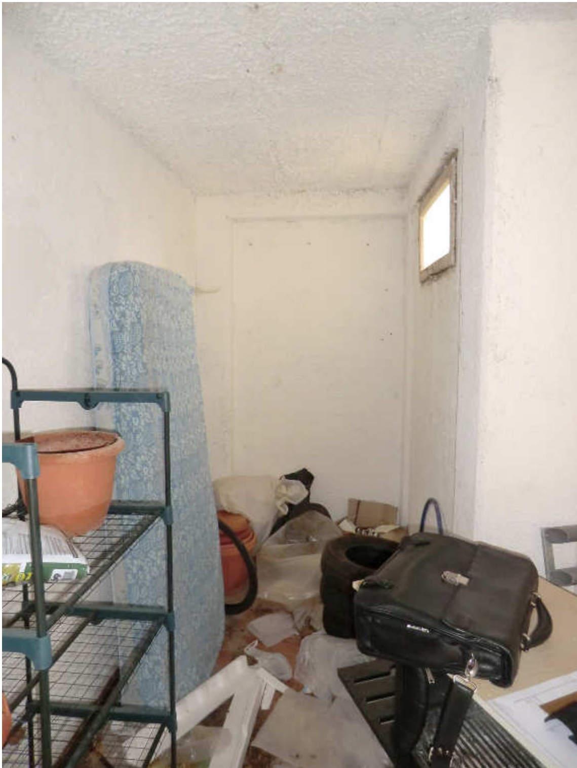
Foto n. 22 - Particolare interno del garage (la zona di fronte alla finestra dovrebbe far parte del box adiacente)