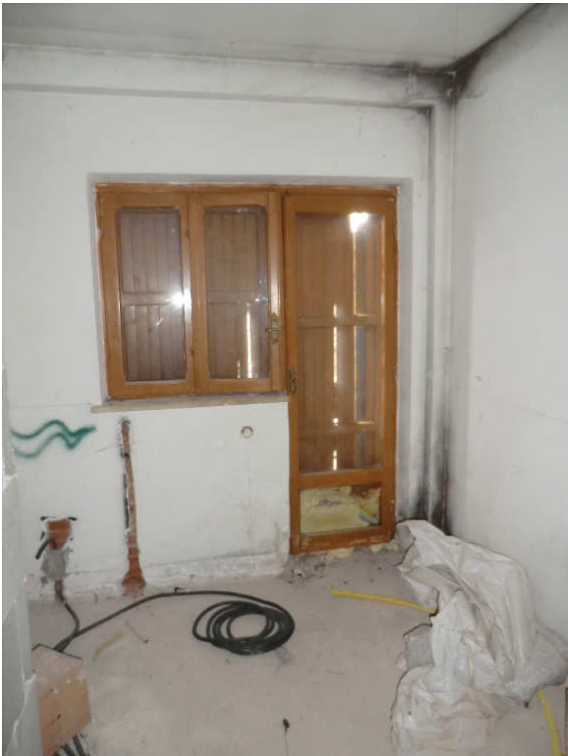
Foto n. 17 - Particolare degli infissi esterni