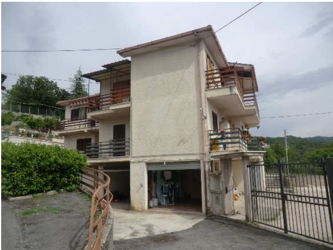
Foto n. 1 - Vista generale del fabbricato dalla strada di accesso