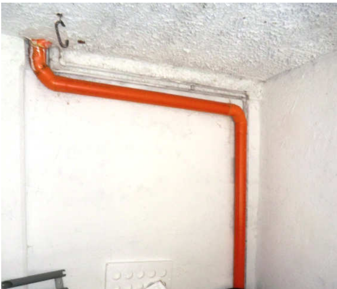
Foto n. 21 - Tubazioni passanti nel garage