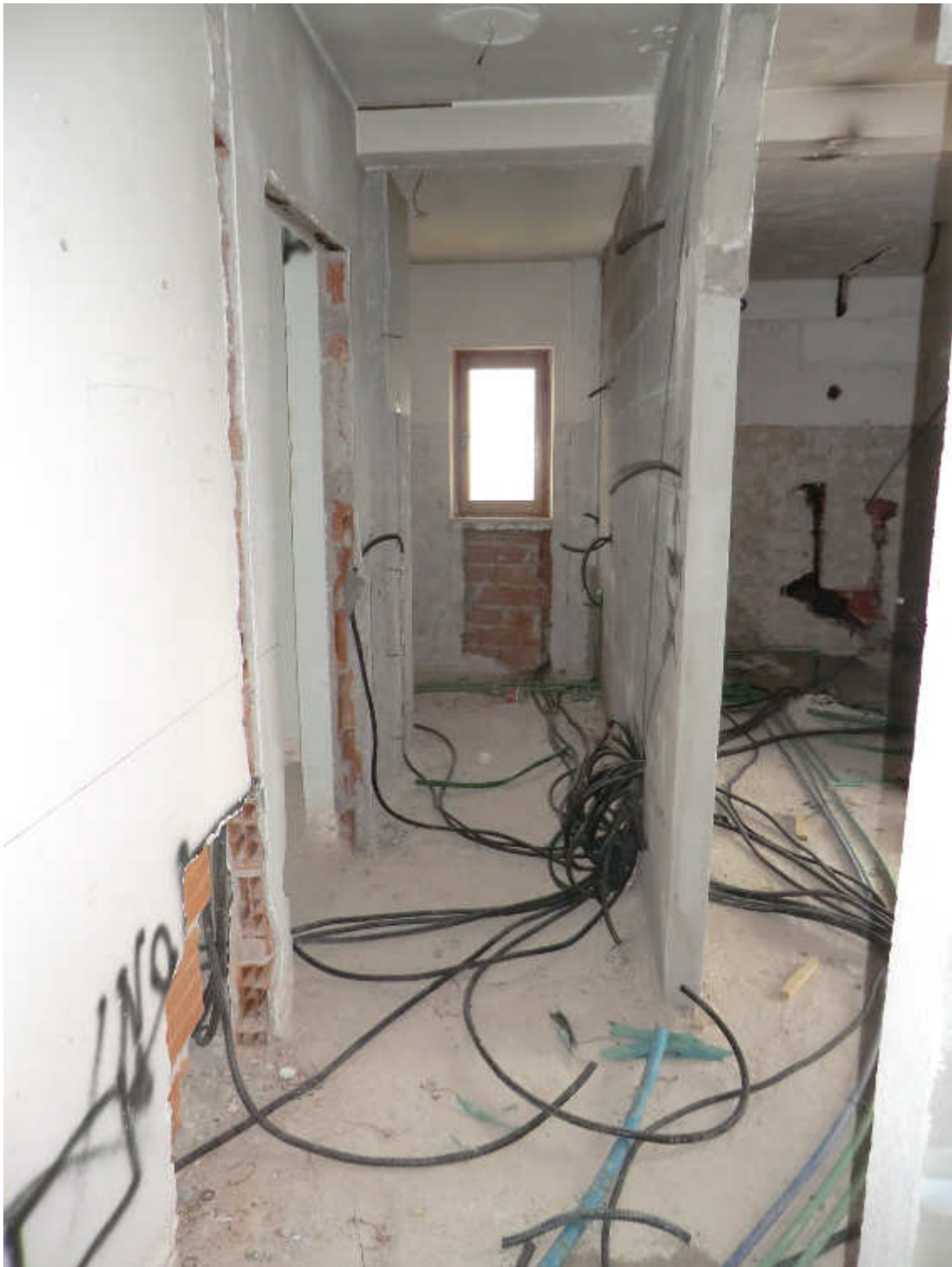
Foto n. 14 - Disimpegno nella zona notte