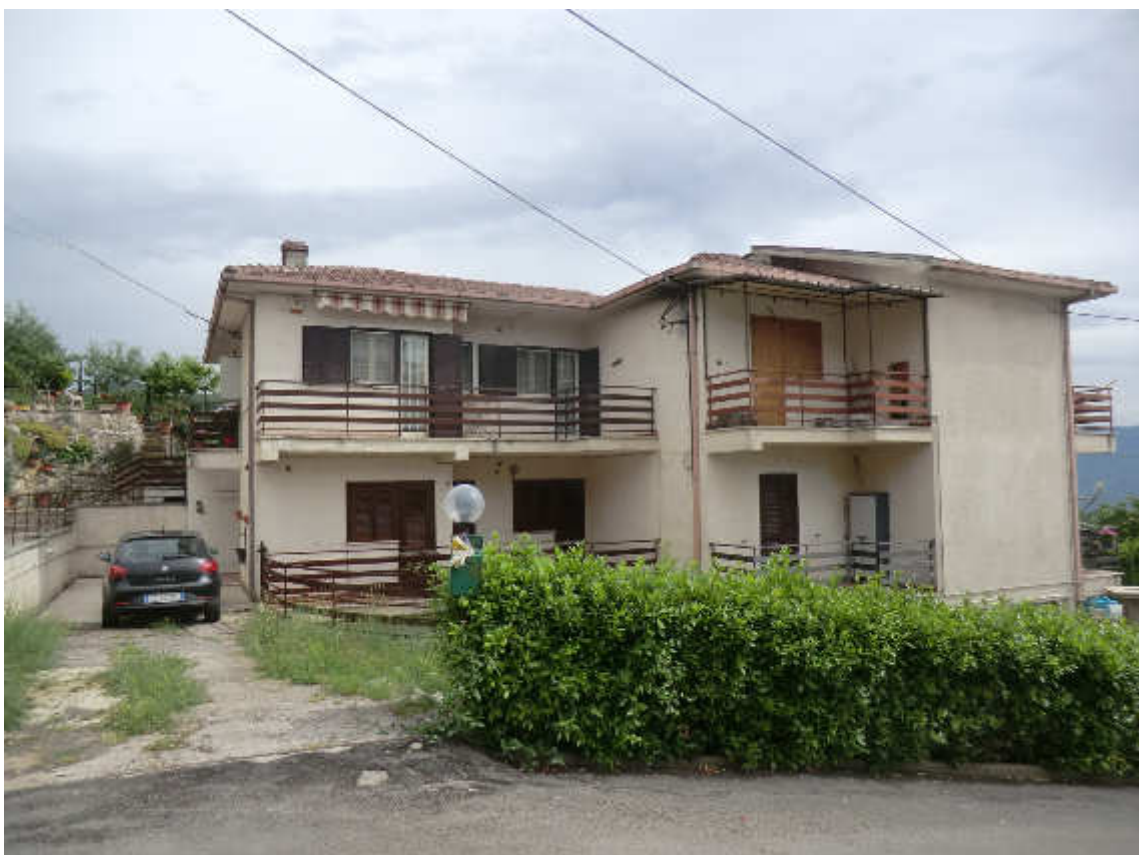
Foto n. 2 - Altra vista del fabbricato dalla strada