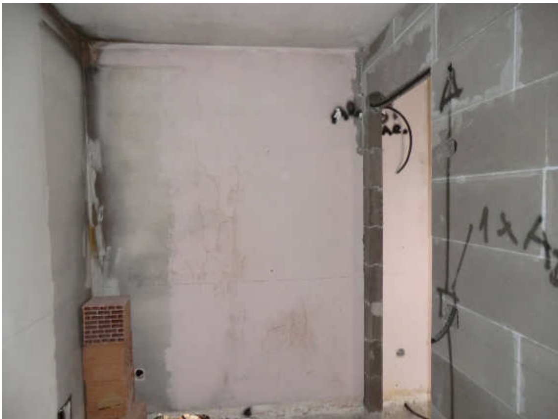
Foto n. 15 - Ingresso di una delle camere da letto