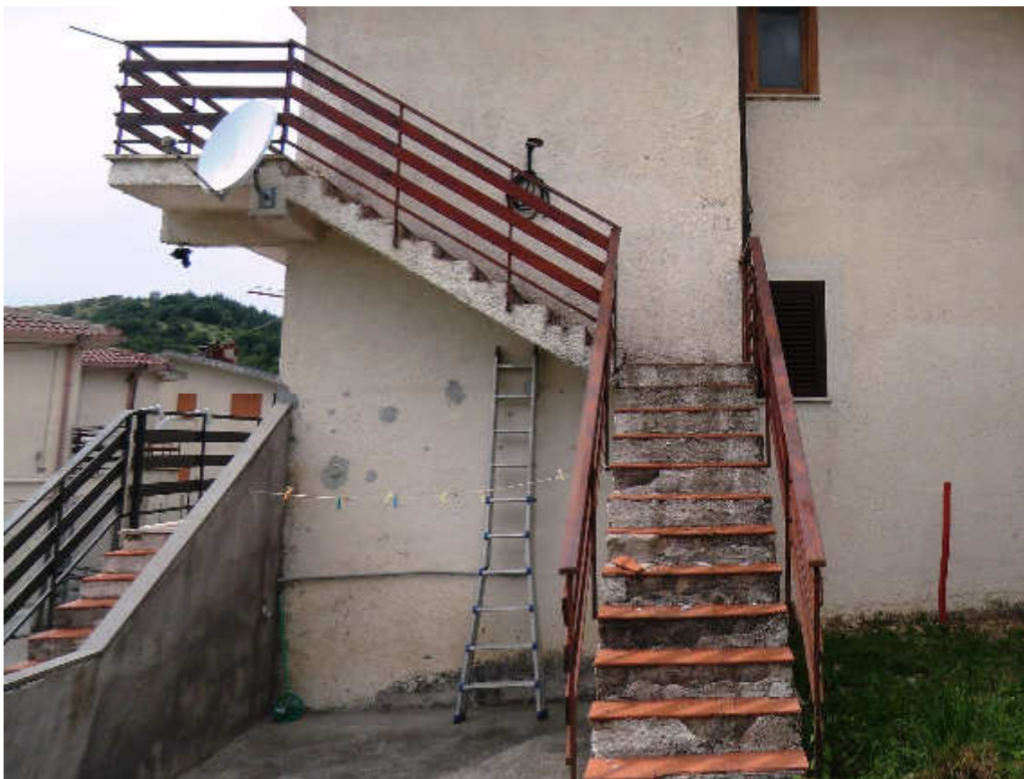
Foto n. 6 - Particolare scala d'accesso all'appartamento oggetto di stima