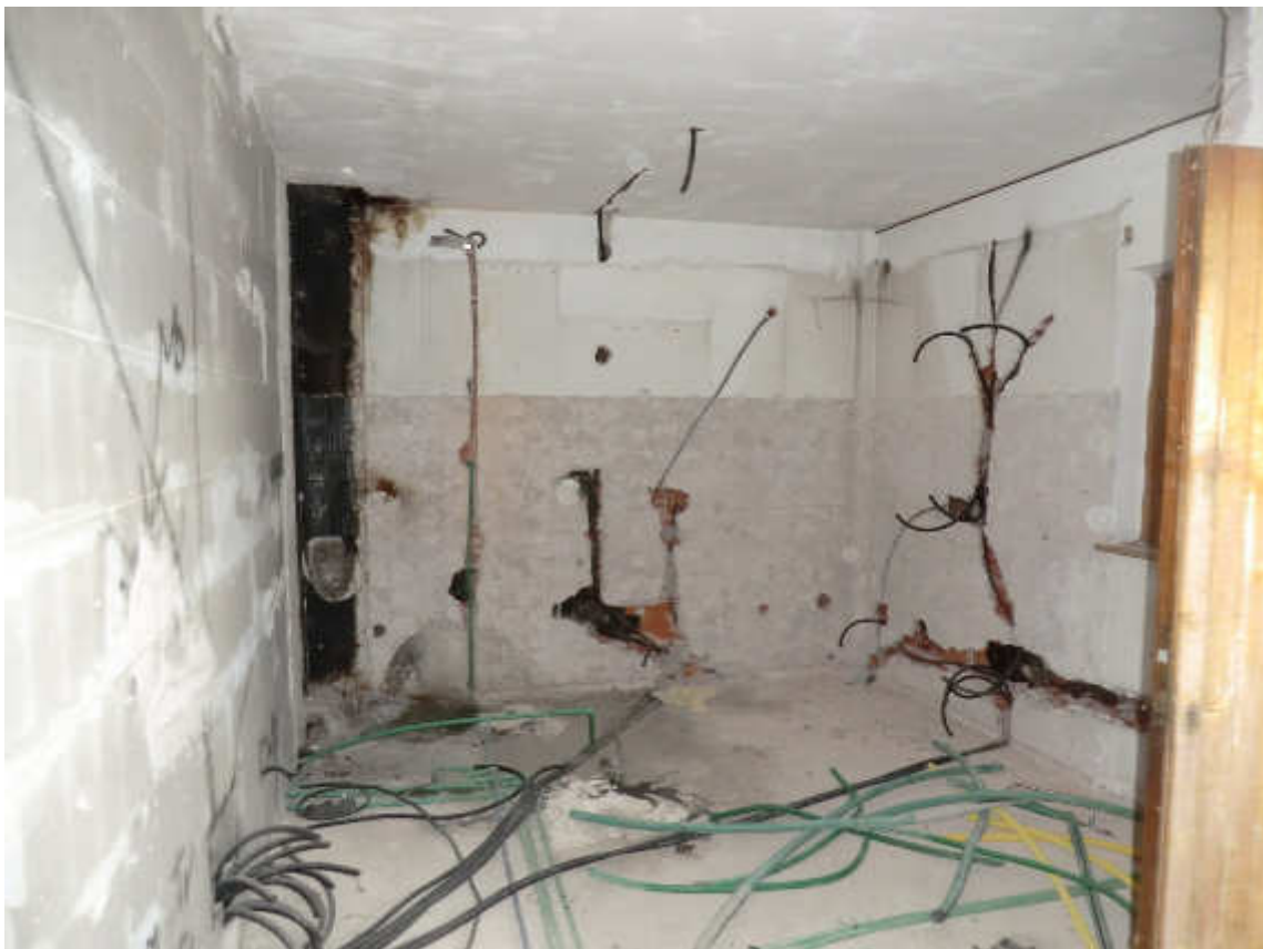
Foto n. 9 - Zona pranzo cucina in fase di ristrutturazione