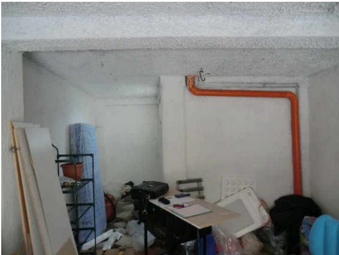
Foto n. 20 - Particolare interno del garage