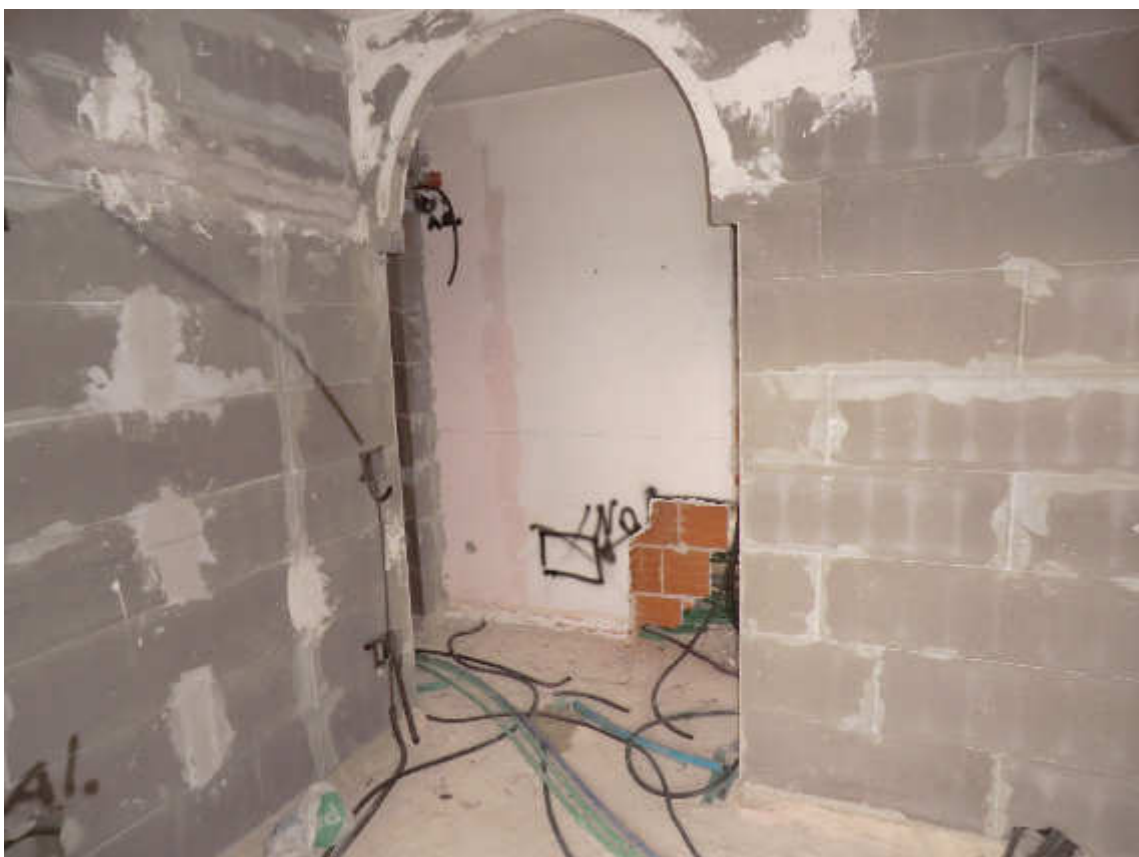
Foto n. 13 - Apertura di passaggio dalla zona giorno alla zona notte