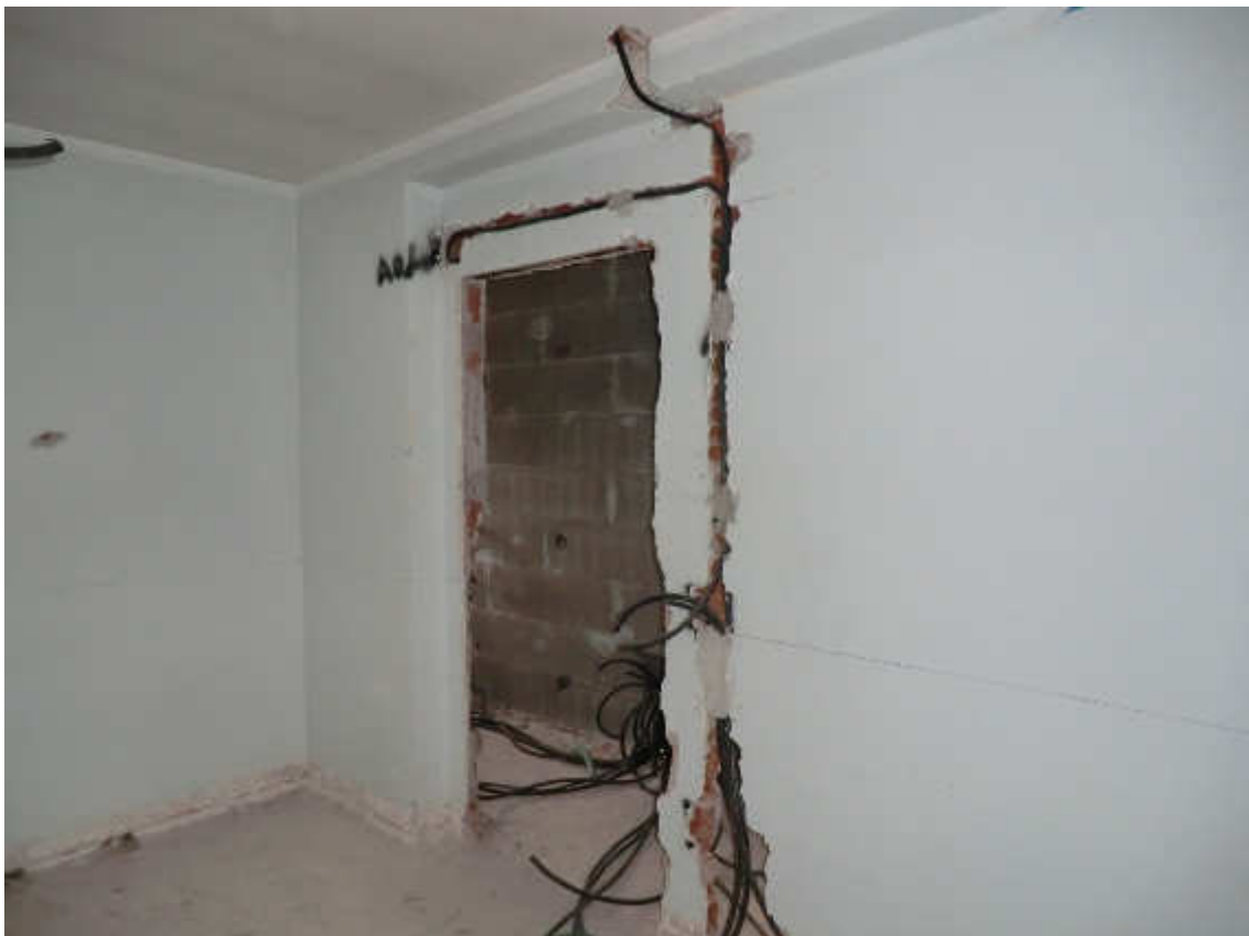
Foto n. 16 - Ingresso dell'altra camera da letto