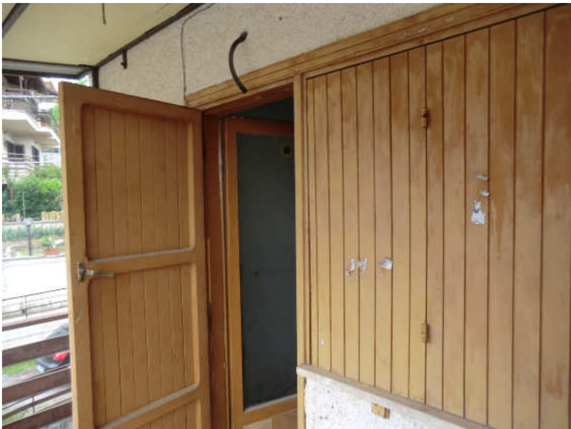
Foto n. 7 - Ingresso dell'appartamento visto dall'esterno