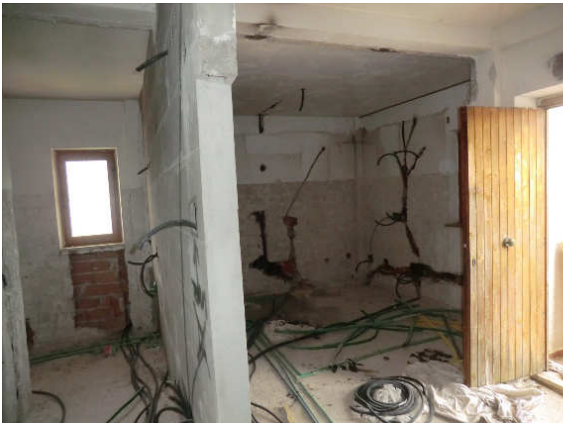
Foto n. 12 - Scorcio della cucina e dell'ingresso del bagno