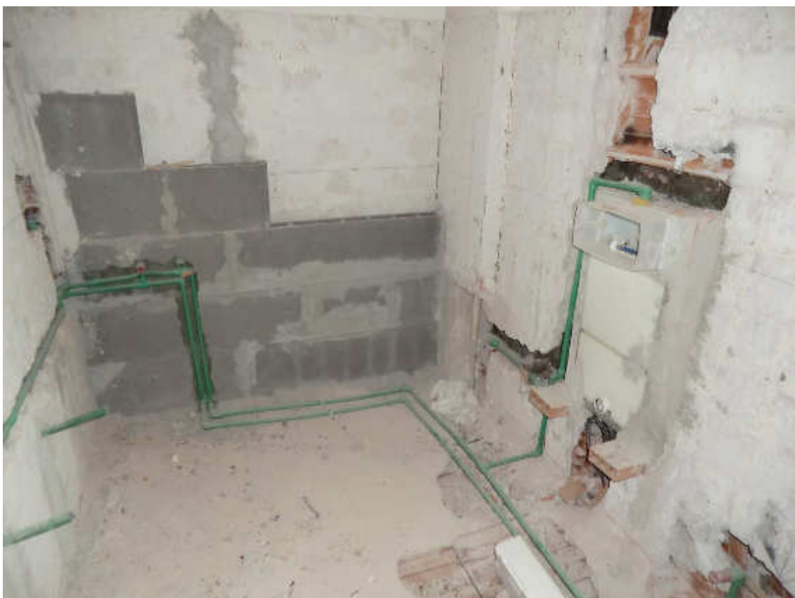
Foto n. 10 - Bagno in fase di ristrutturazione