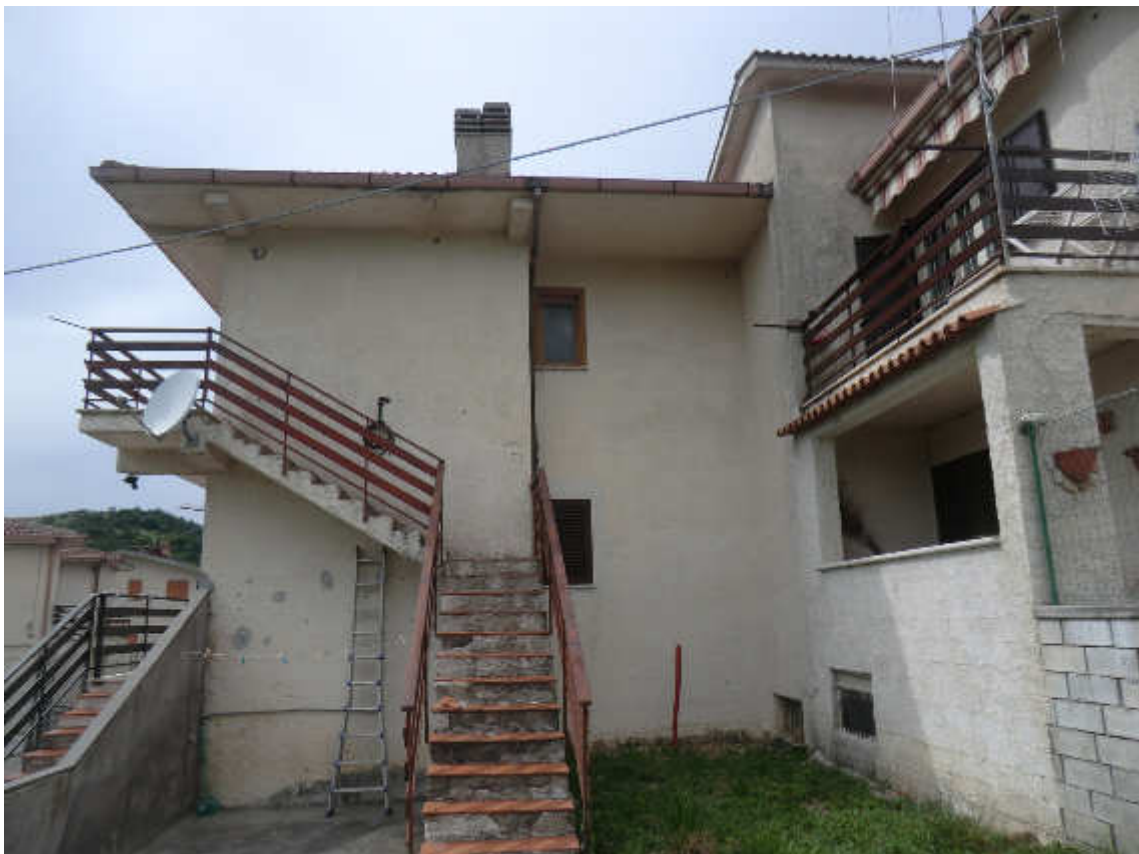
Foto n. 4 - Vista posteriore del fabbricato